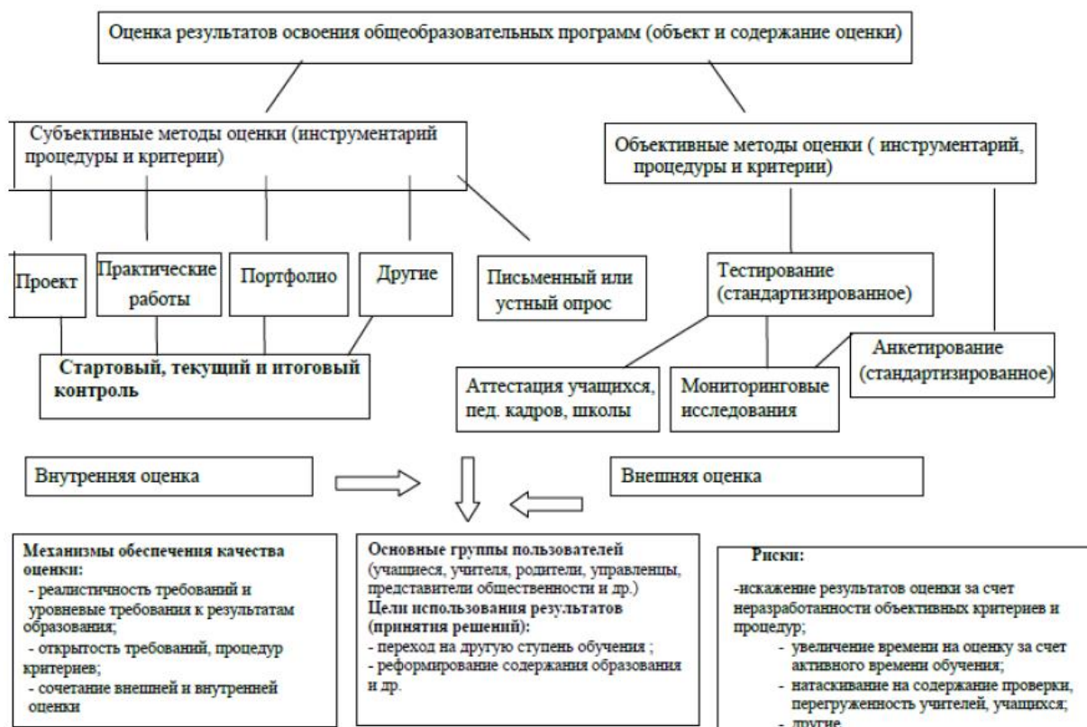
Рисунок 1. Модель системы оценки результатов освоения общеобразовательных программ и её основные компоненты

В соответствии с принципами преемственности образования в основной школе принята за основу модель системы оценки результатов освоения образовательной программы и её основных компонентов, разработанная в ОП НОО.