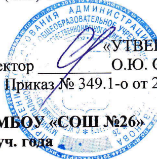
График проведения оценочных процедур в МБОУ «СОШ №26» во втором полугодии 2023/2024 уч. года